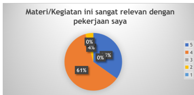
Gambar 4. Hasil Evaluasi Kegiatan PKM Seberapa Relevankah Kegiatan

Dari indikator keberhasilan tersebut, dapat dilihat pada hasil evaluasi yang telah diisi oleh para peserta kegiatan pelatihan.