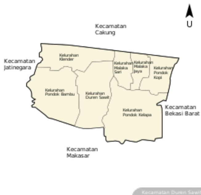
Gambar 2. Peta Kecamatan Duren Sawit

Kecamatan ini berbatasan dengan Kecamatan Cakung di sebelah utara, Kecamatan Jatinegara di sebelah barat, Kecamatan Bekasi Barat di sebelah timur, dan Kabupaten Makassar di sebelah selatan, seperti terligat pada Gambar 2 [7].