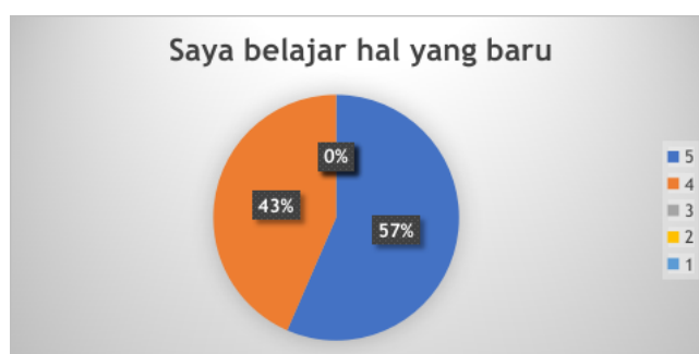
Gambar 7. Hasil Evaluasi Para Peserta Mendapatkan Hal Baru