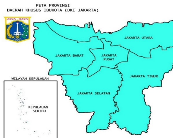
Gambar 1. Peta Jakarta

Daerah Khusus Ibu kota Jakarta (DKI Jakarta), seperti terlihat pada Gambar 1 adalah Ibu Kota Indonesia dan kota terbesar di Indonesia. Jakarta adalah satu-satunya kota di Indonesia yang berstatus setingkat negara bagian. Jakarta terletak di pantai barat laut Jawa. Dahulu dikenal dengan beberapa nama seperti Sunda Kelapa, Jayakarta dan Batavia. Jakarta memiliki luas kurang lebih 661, 52 Km 2 (laut: 55, 6.977, 5 Km 2 ) dan jumlah penduduk 11.100.929 jiwa (2020). Wilayah metropolitan Jakarta (Jabodetabek) yang berpenduduk sekitar 28 juta jiwa, merupakan wilayah metropolitan terbesar kedua di dunia di Asia Tenggara [6].