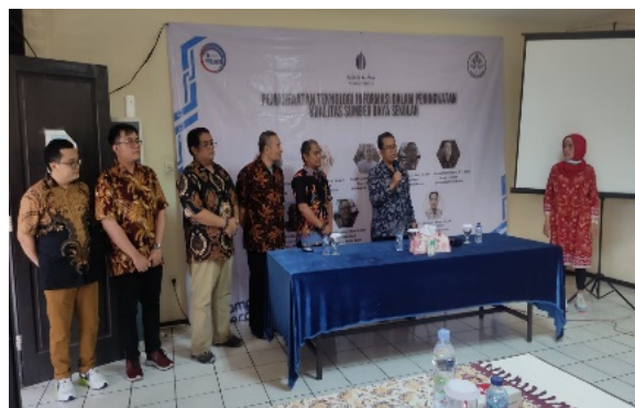
(b) Sambutan dari Mitra