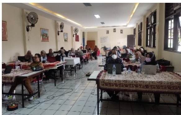
(a) Peserta PkM

Untuk pelaksanaan kegiatan kelompok kami mendapat giliran pada jam 08:45 - 09:45 WIB. Fasilitas kegiatan proyektor, ruang kegiatan yang berada pada lingkungan Yayasan Asih Budi Jakarta Timur.