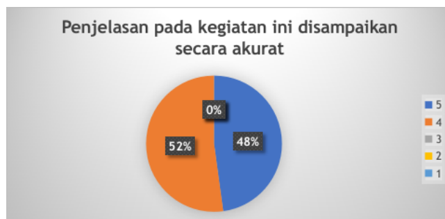
Gambar 6. Hasil Evaluasi Pemaparan Disampaikan Secara Akurat