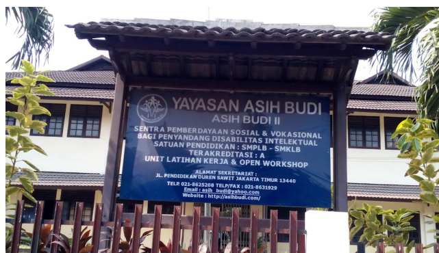
Gambar 3. Yayasan Asih Budi Duren Sawit, Jakarta Timur

Salah satu kegiatan tridharma perguruan tinggi adalah kegiatan Pengabdian Kepada Masyarakat (PKM), kegiatan ini adalah wadah bagi dosen atau pembinaan mahasiswa dapat menyalurkan minat dan bakatnya untuk mengamalkan keahlian ilmiahnya di tengah masyarakat. Kelebihan lain dari kegiatan ini adalah membuat mahasiswa lebih peka terhadap orang yang membutuhkan.